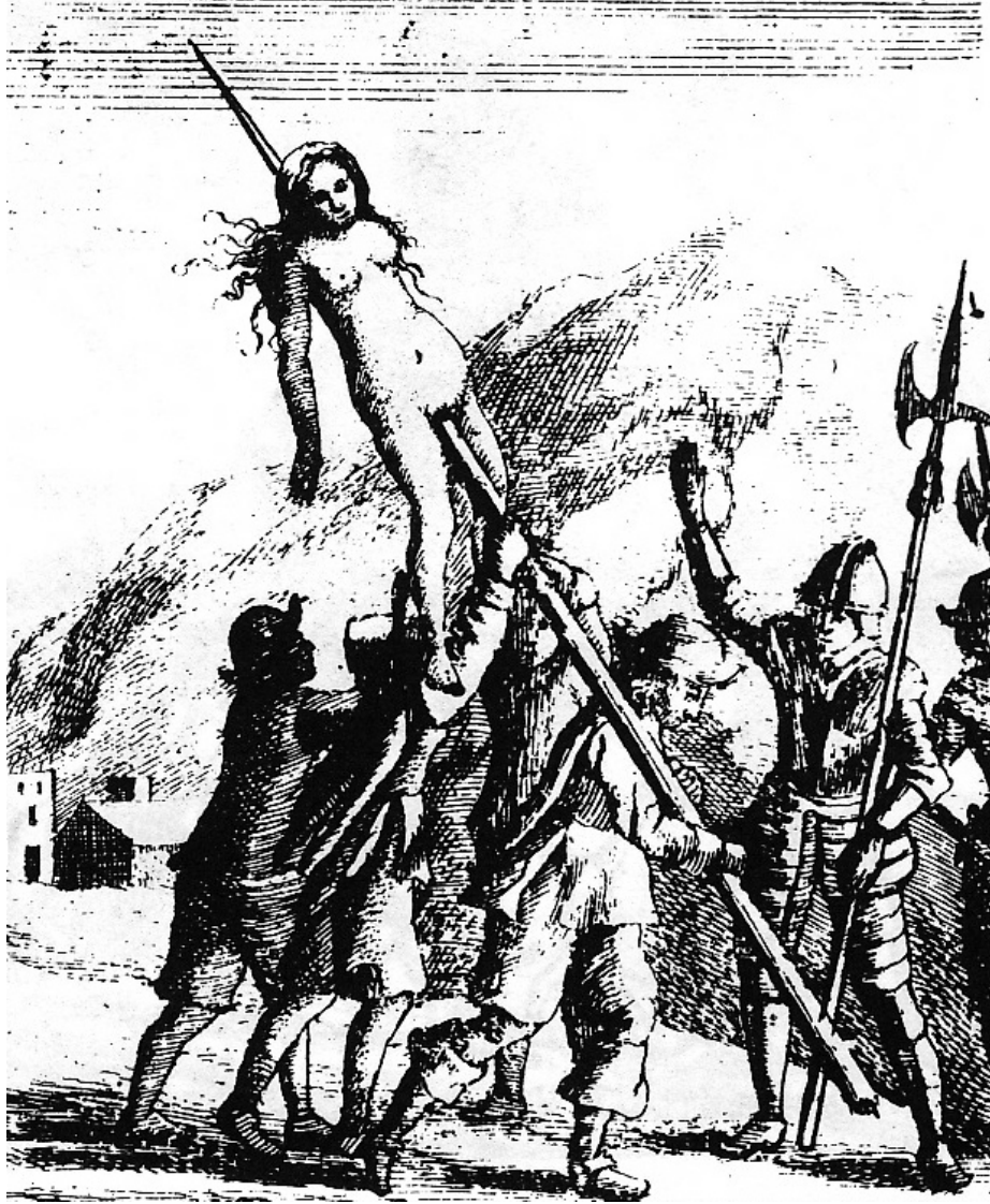
Afbeelding 3: Anna Charboniere werd met goedkeuring van Rome gespietst en rondgedragen. Print illustrating the 1655 massacre in La Torre, from Samuel Moreland's History of the Evangelical Churches of the Valleys of Piedmont, published in London in 1658. Bron: Wikipedia.