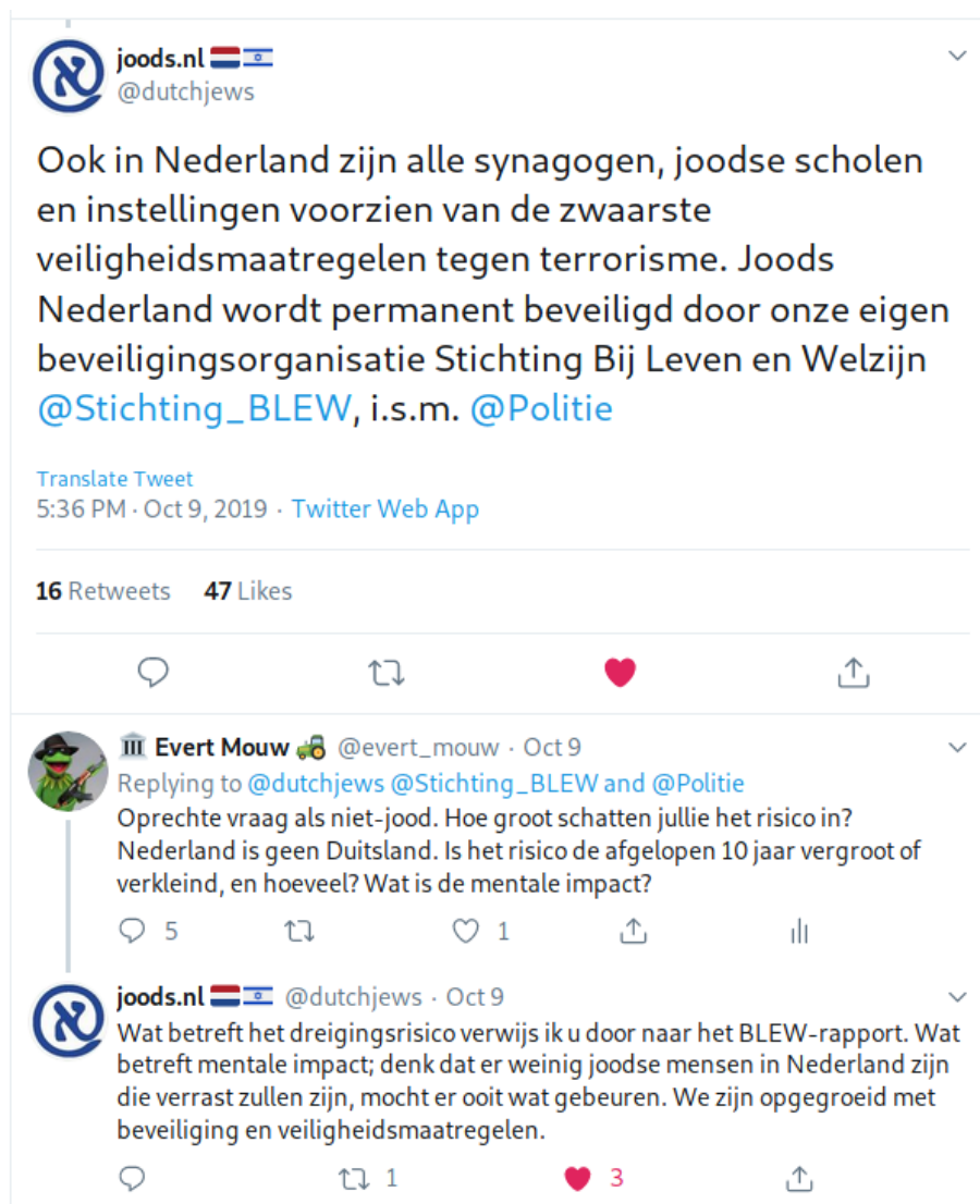
Afbeelding 1: Weer op de radar dankzij Twitter.